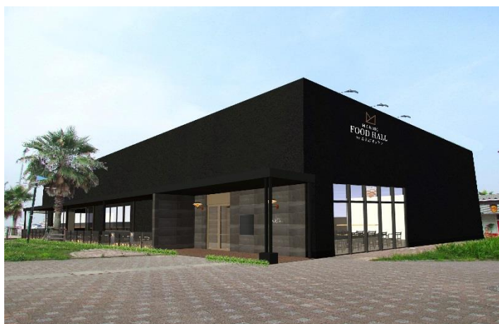
▲店舗外観（イメージ）