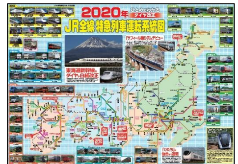
↑ 特急列車運転系統図ポスター

特別付録はB2判のポスター。表面は2年ぶりに復活となる「JR全線特急列車運転系統図ポスター2020」。ダイヤ改正後に使用される新幹線・特急列車の車両写真と全特急の系統図を紹介しています。裏面はダイヤ改正前に引退する東海道新幹線の700系を偲ぶ「ありがとう700系ポスター」となっています。