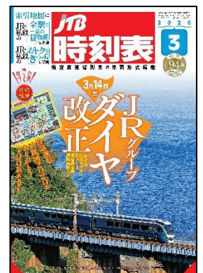
↑本誌表紙はダイヤ改正でデビューする「サフィール踊り子」

ダイヤ改正で運行系統が大きく変わる首都圏の中央線。今月号に限り全駅全列車を掲載します。また、注目の新駅「高輪ゲートウェイ駅」の山手線・京浜東北線の駅時刻表（駅で見かける発車時刻のみの時刻表）も掲載しています。