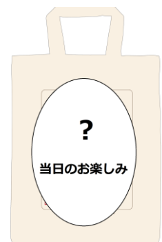
トートバッグ(イメージ)