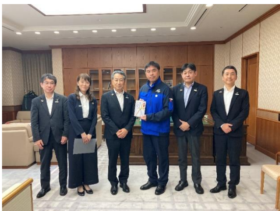
馳知事と JTB 役員/令和 6 年 7 月 24 日